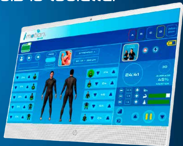
ÉCRAN TACTILE 22"