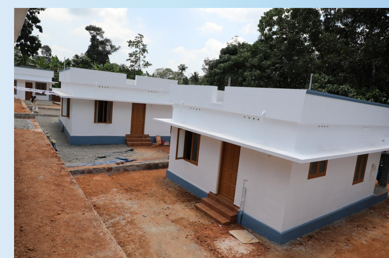
Hausbauprojekt des Vereins in Periyapuram

Daneben wurden Einzelpersonen, etwa bei der Finanzierung ihrer Ausbildung oder bei medizinischen Notfällen unbürokratisch und schnell unterstützt.