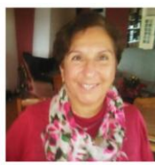
Charo Sauvage Maison de Tobie