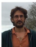
Jean-Baptiste Nedelcu, Arche de Lanza del Vasto