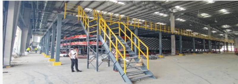
Mazzanine for logistics center