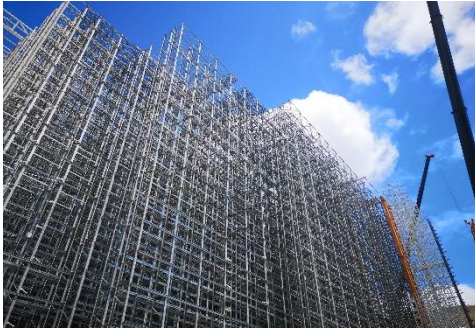
Clad rack SILO warehouse