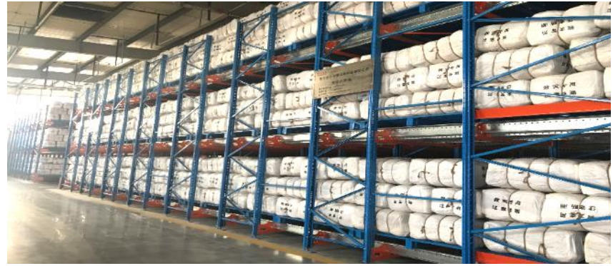
Shuttle rack for food storage (relief material)