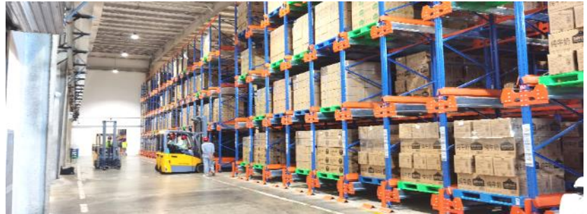
Shuttle rack for milk and beverage