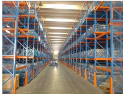
Drive in rack for new energy