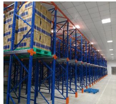
Drive in rack for general merchandise