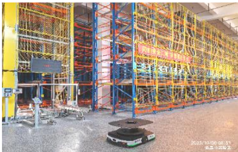
4-way shuttle for medicine