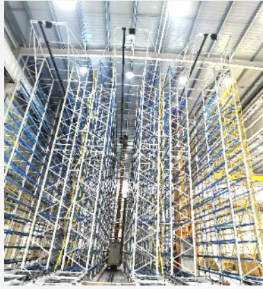
ASRS for machinery factory