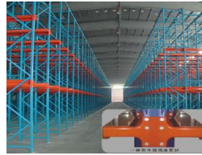
Drive in rack for machinery