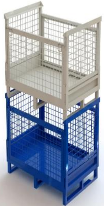
Stackable pallet cage