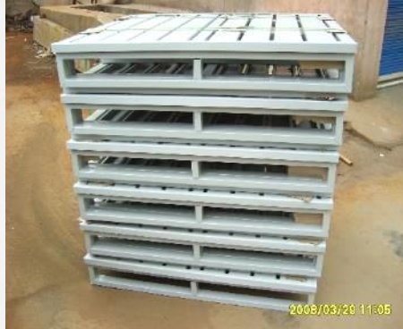
Steel pallet for ASRS