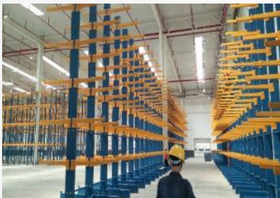
Cantilever rack for pipes