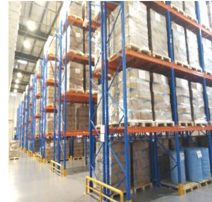
Heavy duty pallet rack