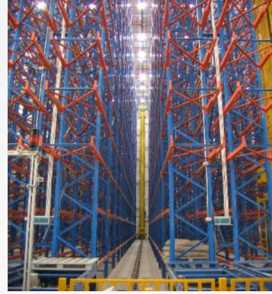
ASRS for finished goods