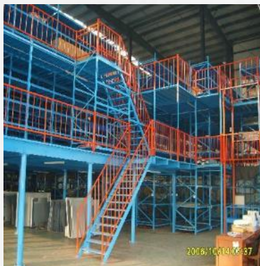
Mezzanine for machinery parts