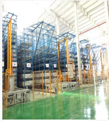
ASRS for subway company