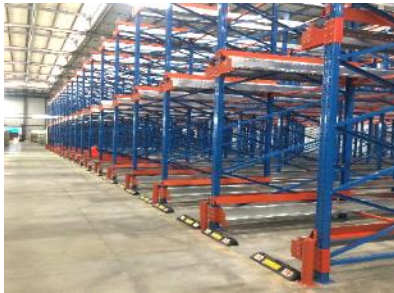
Shuttle rack for raw material