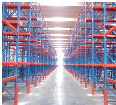
Drive in rack for auto parts