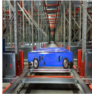
4-way shuttle rack