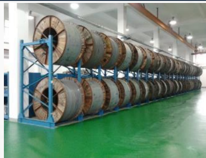
Rack for power cables