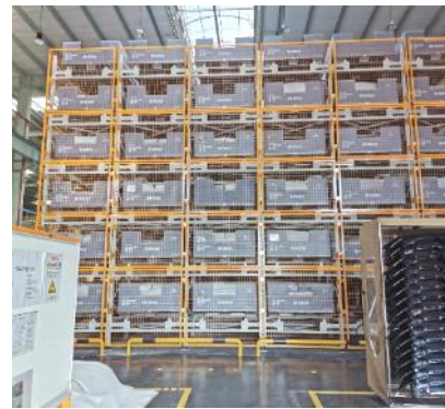
4-way shuttle for finished goods