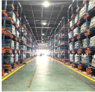
Shuttle rack in bonded area