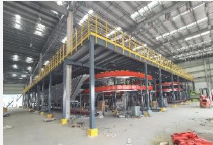
Mazzanine for e-commerce