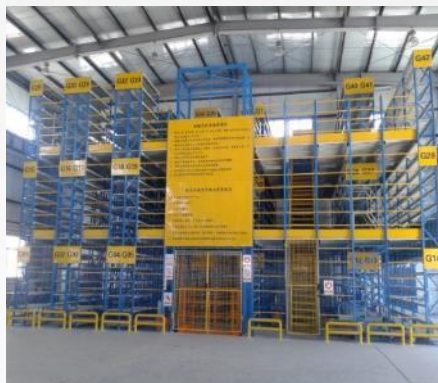
Mezzanine for new energy