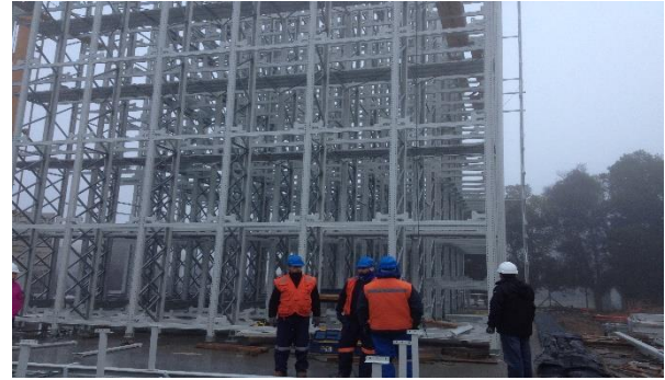
Self-standing shuttle racking