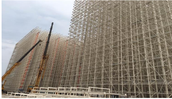
Rack supported building