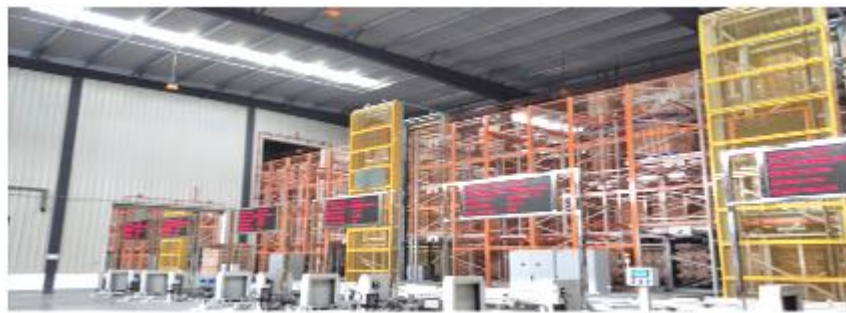
4-way shuttle rack for raw material