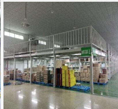
Mezzanine for medicine