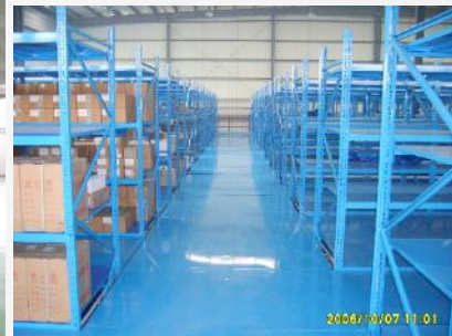
Shelving rack for factory