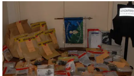
Impliqués dans une expédition punitive, ils seront jugés en mars