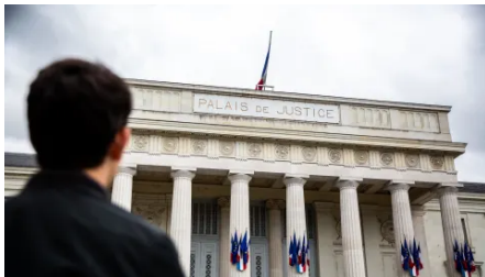
Noyant : les auteurs d'une expédition punitive écopent de 2 à 5 ans de prison