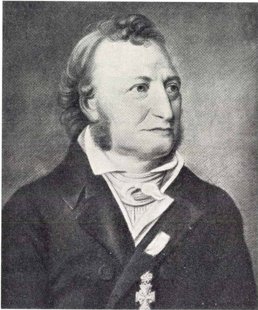
Knud Lyne Rahbek, pastel malet ca. 1812 af Christian Hornemann (Studerforeningen).