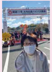
R3,12,18 国道11号 大内白鳥バイパス 松崎～土居区間 開通