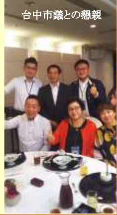
台中市議との懇親

これを受け台湾の横浜分処長が8月20に来静し意見交換、9月20日には台中市から市議団31名が来静し友好関係を深めました。産業、観光、教育、防災等今後も連携強化に尽力したいと思います。