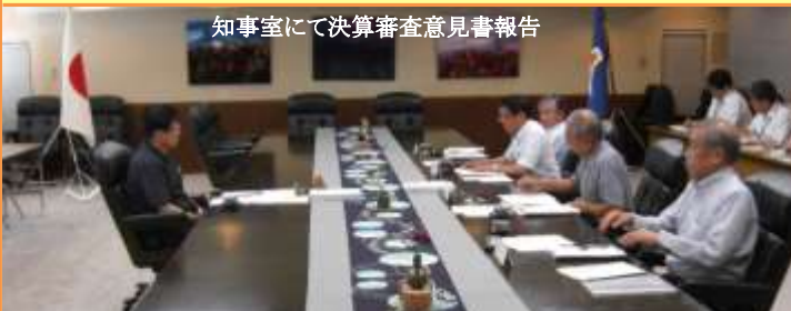
知事室にて決算審査意見書報告

8月は、人事委員会、県直轄組織、食品衛生検査所、袋井土木事務所、9月は、ようやく取りまとめたH30年度の決算審査意見書を知事に報告(上記写真)、この意見書に基づき、各常任委員会毎に審査する決算特別委員会(10月～11月)が開催されることとなります。10月は、金谷高校、環境放射線監視センター、環境衛生科学研究所移転整備事業を監査しました。