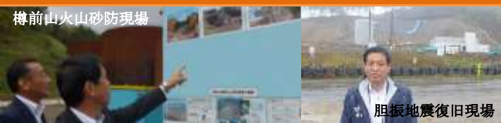
樽前山火山砂防現場