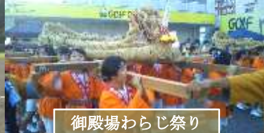
御殿場わらじ祭り