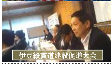
伊豆縦貫道建設促進大会