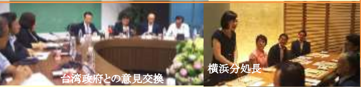
台湾政府との意見交換