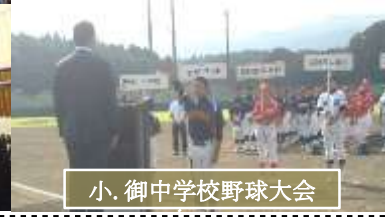
小、御中学校野球大会