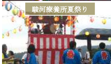
駿河療養所夏祭り