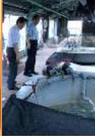
焼津水産高校（養魚施設）

今回は、清水税関で密輸の実態、県立図書館で今後の移転の問題、焼津水産高校で特色あるキャリア職業教育の実態等を見分でき、今後の県行政に活かします。