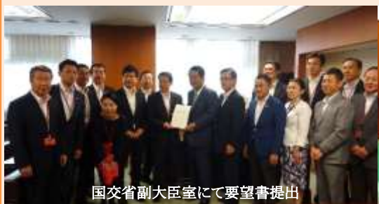
国交省副大臣室にて要望書提出