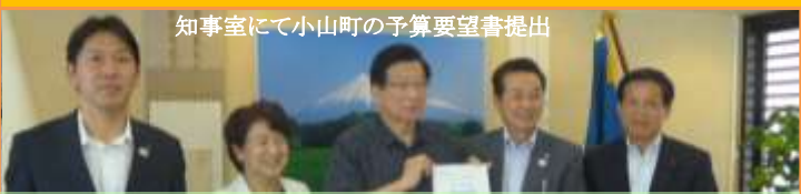
知事室にて小山町の予算要望書提出

10月2日、小山町が知事に対して行う令和2年度の予算要望に同席しました。治山・治水、道路整備、高校教育、観光政策等小山町にとって重要な課題28項目について、その解決や関連事業の推進について県の支援依頼を伝えました。