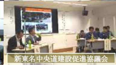
新東名中央道建設促進協議会