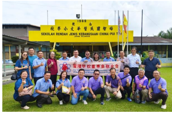
参访团在而榄培智学校合影。