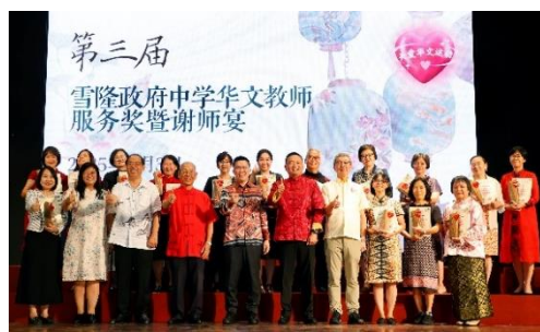
(左图) 雪隆政府中学华文教师服务奖暨谢师宴开幕典礼。