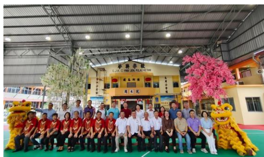
吉胆岛华联华小醒狮队热情迎接，展现中华传统文化风采，为参访活动增添喜庆氛围。