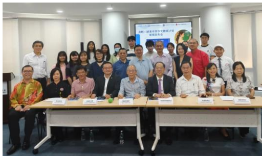
“启航—培育中学华文教师计划”新闻发布会