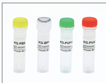
PBS BPY PVP PVA