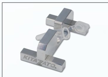
PCRチューブスタンド