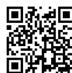
香久山体育館地図