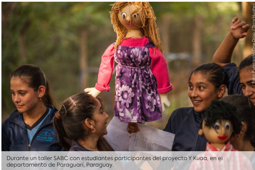
Durante un taller SABC con estudiantes participantes del proyecto Y Kuaa, en el departamento de Paraguari, Paraguay.

“Uno de mis mejores momentos, que yo pude experimentar en los talleres como Agente de Cambio, fue cuando el facilitador nos promovió y nos estuvo siempre inculcando que pudiéramos aprender a modular la voz (...). Eso a mí, en mi vida diaria, me ha ayudado mucho porque yo siempre participo (...), y en las asambleas pues yo necesito esa voz”. - Presidenta de un comité de agua en Nicaragua, participante de múltiples actividades, hablando de una experiencia vida hace 1 o 2 años atrás.