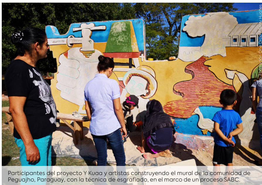
Participantes del proyecto Y Kuaa y artistas construyendo el mural de la comunidad de Peguajho, Paraguay, con la técnica de esgrafiado, en el marco de un proceso SABC.

ciones de SABC. 95% de ellos relacionaron estos cambios con los comportamientos que aborda el Programa, y más comúnmente con el lavado de manos con jabón (78%). Esto coincide con hallazgos del monitoreo del Programa, que evidenció que, comparando la situación a la mitad de implementación de Lazos de Agua y al inicio del mismo, 13% más personas se lavan las manos con jabón. Además de las intervenciones SABC, en este incremento de la práctica del comportamiento influye la mejor cobertura de agua. También, 29% de los entrevistados reconocieron que el cambio del que hablaron tenía que ver con el empoderamiento, la cohesión social, el liderazgo y/o habilidades artísticas: