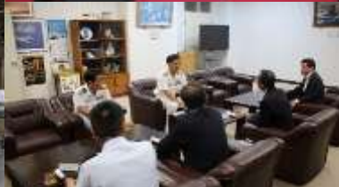
海自：第5航空群司令