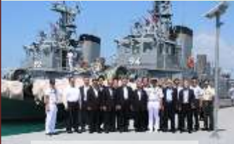
海自：沖縄基地隊長