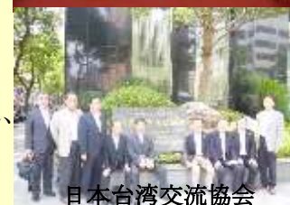
日本台湾交流協会