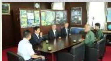
空自：南西航空方面隊司令官