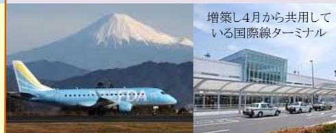
増築し4月から共用している国際線ターミナル

現在静岡空港は、県と地元企業が出資する空港運営会社で運営しているが、開港当初からの民活方向の動きの中で、公共施設の運営権制度を活用した取り組み（本年3月、三菱地所・東急電鉄GPと基本協定締結）が進み、H31年度民営化が決定しました。