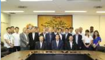
米軍：キャンプハンセン副司令官