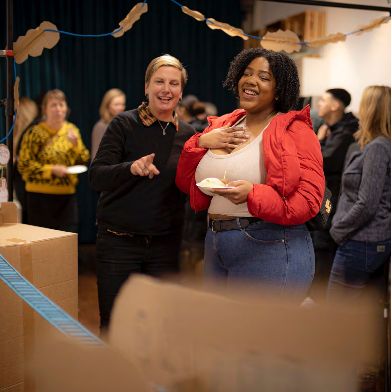
Feestelijke afsluiting ONSbank-programma Rotterdam.