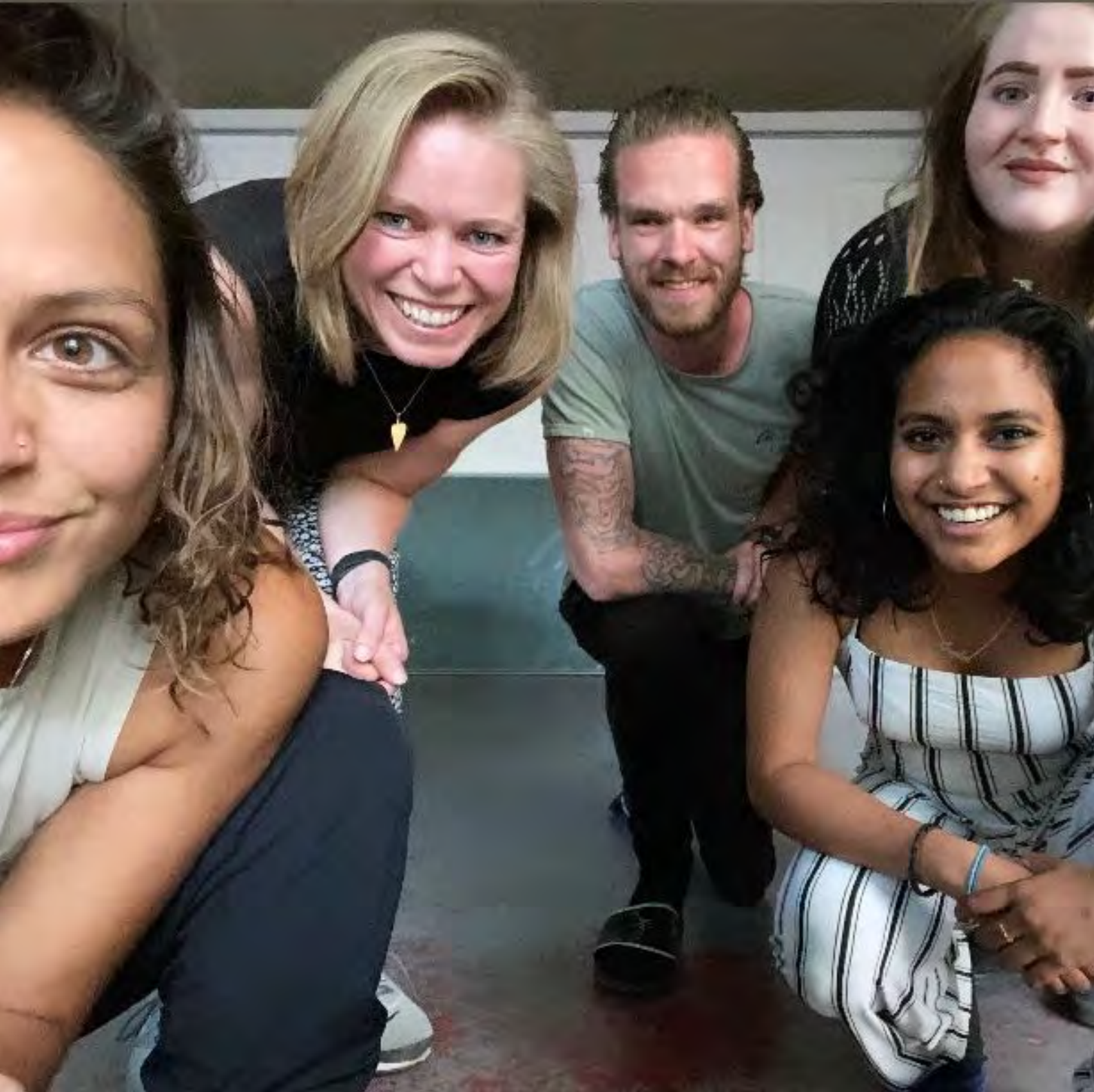
De start van de pilot van het ONSbank Next Level programma