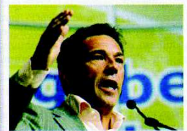
Le défunt Jörg Haider.

LE LEADER DE L'EXTRÊME DROITE AUTRICHIENNE, Jörg Haider, connu entre autres pour ses diatribes xénophobes, est mort accidentellement le samedi 11 octobre. Sa disparition bouleverse la scène politique du pays. Le BZÖ (Alliance pour l'avenir de l'Autriche), son parti, devait en effet son existence et son succès électoral en grande partie à son chef. Son influence était telle que sociaux-démocrates et chrétiens-démocrates se sont «haïdérisés».