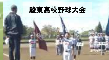
駿東高校野球大会