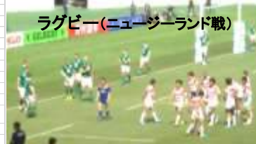
ラグビー(ニュージーランド戦)

県の食肉センター再編整備に係る検討のため、大分県畜産公社を視察し、今後の整備の資を得ました。