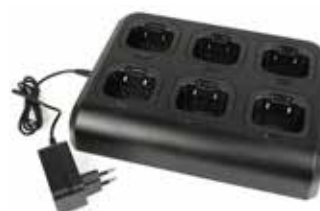
CBM-19 caricatore multiplo opzionale

Pacco batteria agli Ioni di Litio 3,7V/1200mAh PB-20, caricabatterie da tavolo con adattatore da rete CB-19, microfono/auricolare MA-17 con funzione vox, clip da cintura, antenna, manuale operativo in italiano ed inglese.