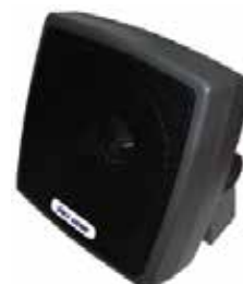
Cod. C1005108 Mod. SP-61