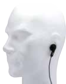
CON PTT E CLIP