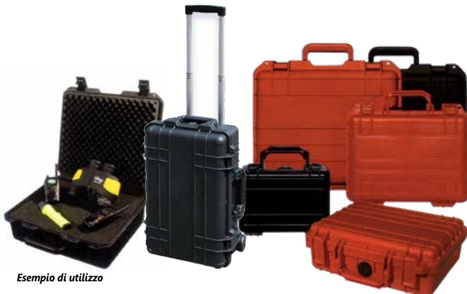
Esempio di utilizzo