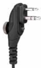
MA-2042/CCH • HYTERA PD400/ PD500