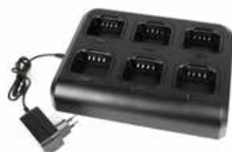
CBM-26 caricatore multiplo opzionale