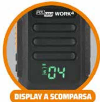
DISPLAY A SCOMPARSA