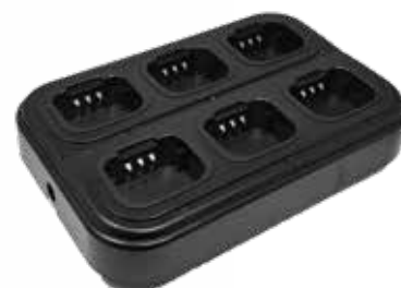
EDC-336E - caricatore multiplo opzionale