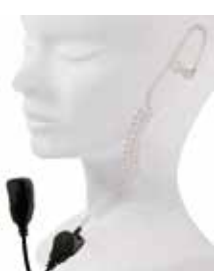
AD ARIA CON PTT E CLIP