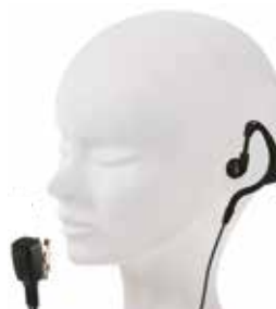
AD ARCHETTO CON PTT E CLIP