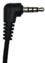
MA-17 MA-19 • POLMAR GEMINI/CUBE