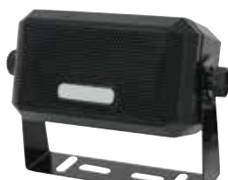
Cod. C1005105 Mod. SP-16 DISPONIBILE ANCHE VERSIONE 4 OHM (C1005100)

*attacco di tipo "I"/"IF" (vd. paragrafo connettori)