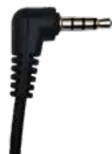
MA-21 • POLMAR MICRO