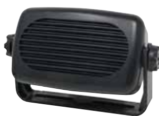
Cod. C1005106 Mod. SP-35