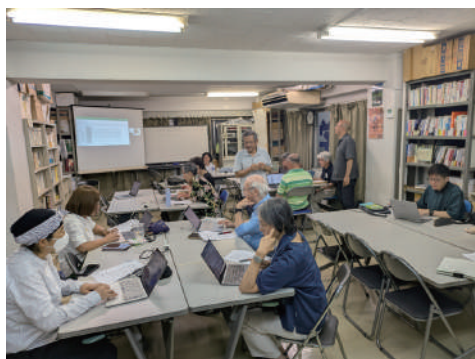
2025年度の「社会調査力アップ入門講座」の様子

先行研究に触れて、収集した資料やデータを読み込んだら、現地調査のための「問い」を設定します。前回の授業をうけて、資料やデータを分析して、一人ひとりの「問い」を設定しましょう。