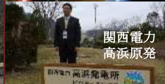
関西電力 高浜原発

高速道から料金所を通過して道の駅に立ち寄っても、高速道路を下りたことにならない料金で引き続き高速道の使用が可能となる社会実験が、愛知県の道の駅で行われています。併せて視察しました高浜原発での防災上の取り組みを含め、今後の県の関連施策に反映したいと思っています。