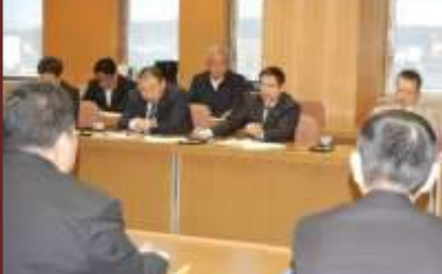
#4三役・政調と財政当局との折衝