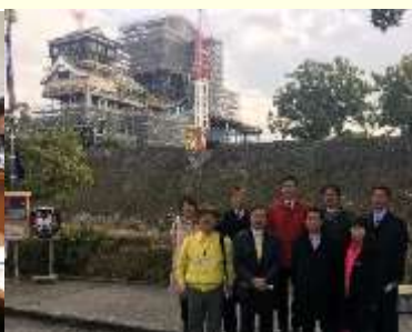
修復が進んでいる熊本城