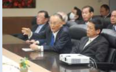
会派としての知事への申し入れ

産業分野では技術革新、経営革新、農林・水産販路拡大等、子育て、医療・福祉分野では、子供医療費助成、地域包括ケア推進等、観光交流分野では、オリ・パラ関連、観光施設整備等、教育分野では、特別支援学校教育環境整備、私学教育支援等、危機管理分野では、地震・津波対策の充実等、豊かな暮らし分野では県単整備事業費の増額等の実現等について、ほぼ要求に沿った予算の確保ができたものと思っています。