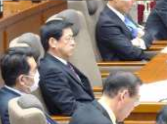
2月定例議会時の会派の構成