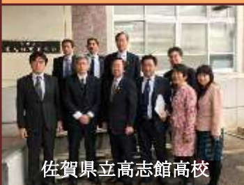
佐賀県立高志館高校