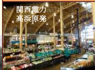
関西電力 高浜原発