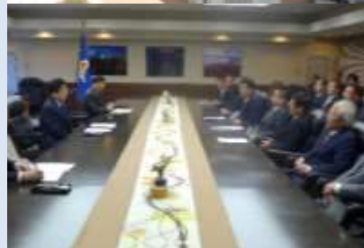
会派としての知事への申し入れ