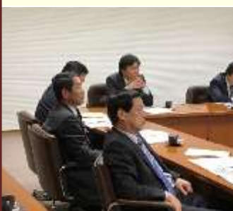
福岡県教育委員会

今回の視察では、佐賀県立高志館高校におけるICT利活用教育の推進状況、福岡県での高校・大学連携事業及び暴力団対策の現況、熊本城の修復状況、熊本県運転免許センターにおける認知症等運転適性相談の対応等について現況を把握、今後の教育、警察行政への反映の資を得ることができました。