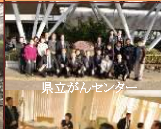
県立がんセンター