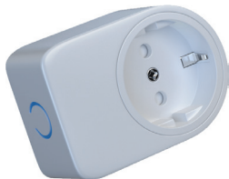
Elektronisk bryter for separat steikeovn.

Om du ikke har separat steikeovn, kan du benytte denne til mikrobølgeovn, oppvaskmaskin eller annet apparat som kan representere brannfare på kjøkkenet. (Max 3600W).