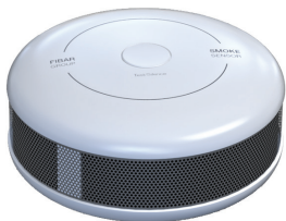
Trådløs, optisk røykdetektor