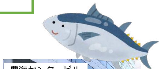
豊海センタービル