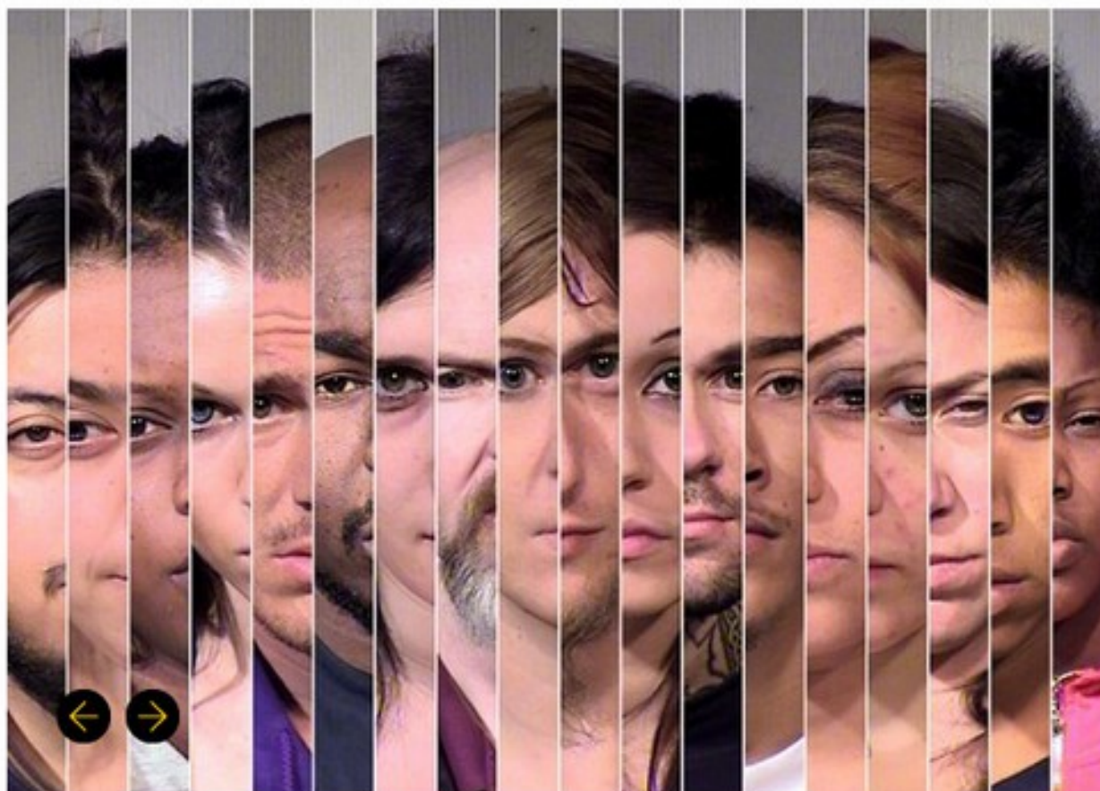
Darius Koehli Ficha policial (fotograma) / Mugshots (still), 2013 © Darius Koehli. VEGAP, Madrid, 2014