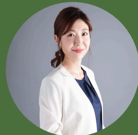
小原治五右衛門後援会 アンバサダー