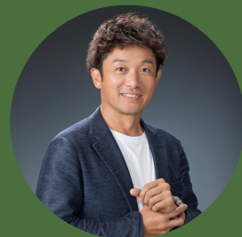
小原治五右衛門後援会 会長