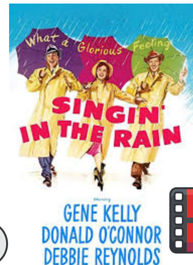
Film musical de Stanley Donen et Gene Kelly Le dur passage de deux stars du muet au cinéma parlant