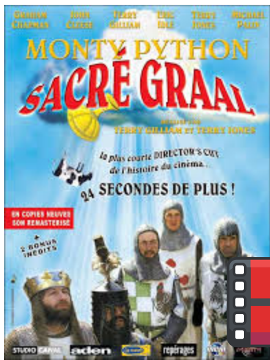
Ecrit et réalisé par Terry Gilliam et Terry Jones Film à sketches loufoque autour de la quête du Graal

On vous propose de revoir une sélection de films qui font du bien !