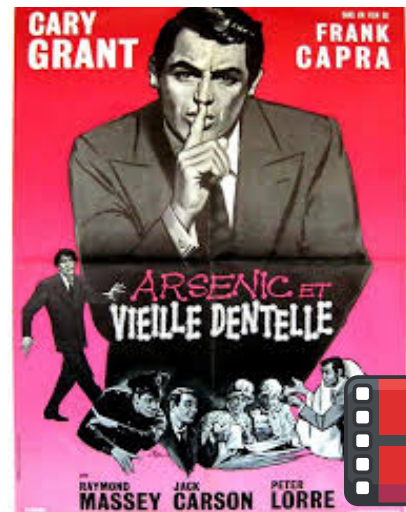
Réalisé par Franck Capra 2 vieilles tantes spécialisées dans la suppression de vieux messieurs riches !