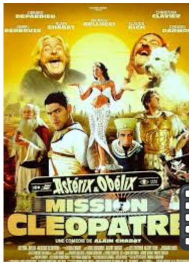
Réalisé par Alain Chabat 3 mois ! C'est le temps donné par Cléopâtre pour construire le plus grand palais du monde