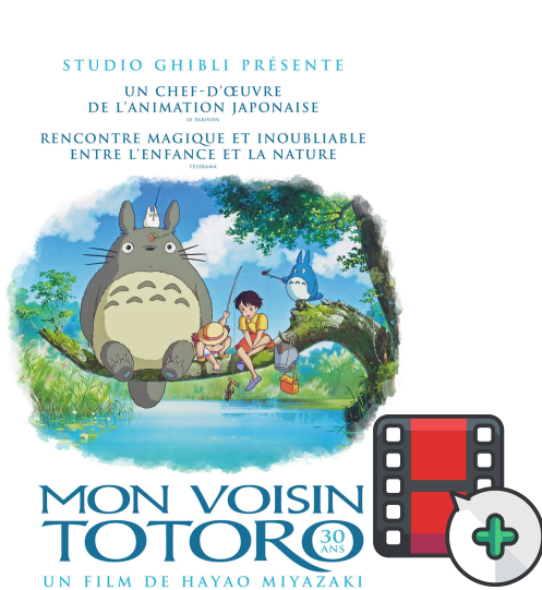
Ecrit et réalisé par Miazaki Deux petites filles vont faire la connaissance des "totoros" petits génies de la forêt