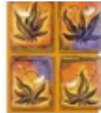
LES 4 ACCORDS TOLTEQUES DON MIGUEL RUIZ