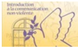
LES MOTS SONT DES FENÊTRES MARSHALL B. ROSENBERG