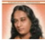
AUTOBIOGRAPHIE D'UN YOGI PARAMAHANSA YOGANANDA