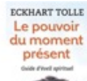
LE POUVOIR DU MOMENT PRÉSENT ECKHART TOLLE