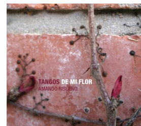
Tangos de mi flor Rennes, 2013