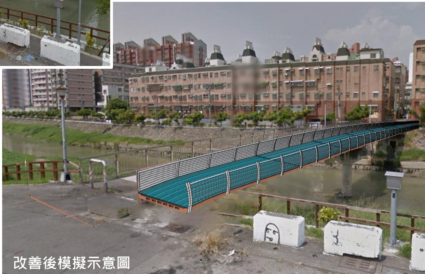
改善後模擬示意圖