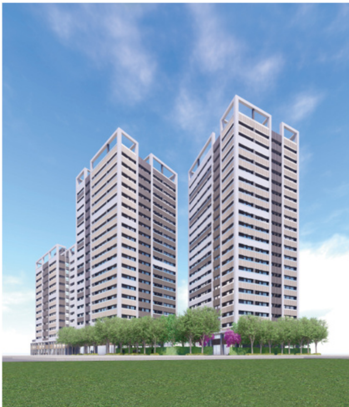
最新作品「基泰圓山」立面示意