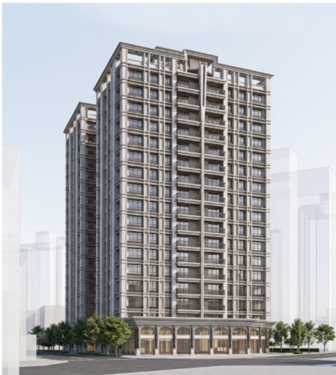
最新作品「基泰中和」立面示意