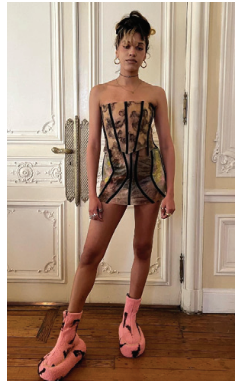
Diseño y PH: Clara Pinto @laclarapinto