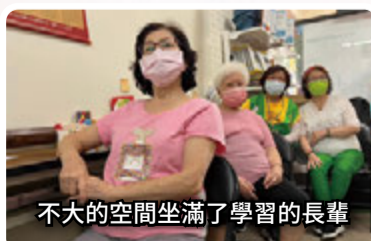
不大的空間坐滿了學習的長輩