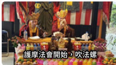
護摩法會開始，吹法螺