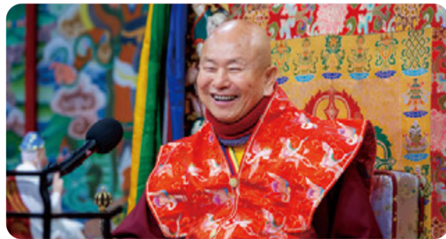
修持敬愛法改運 仍有因果在其中 薩埵改成不打耶 即是如來百字明

佛法強調因果，但 盧師尊教導弟子修持「敬愛法」，能令修持者得眾生敬愛，改變命運。上周末同修有美國弟子就提問：如果一個人心性不正，但他卻因修持敬愛法獲得眾人支持當上總統，是否會成為這些人的共業？一般人修持敬愛法，得老闆賞識升職，卻沒有過人才能，可能將公司搞得一團亂，如何才是正確且有智慧的看法？