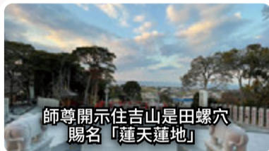
師尊開示住吉山是田螺穴 賜名「蓮天蓮地」