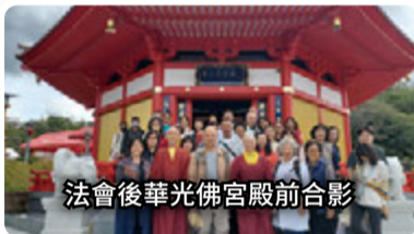
法會後華光佛宮殿前合影