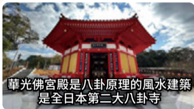
華光佛宮殿是八卦原理的風水建築 是全日本第二大八卦寺