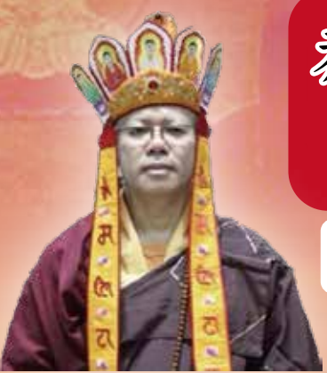
長老釋常仁金剛上師