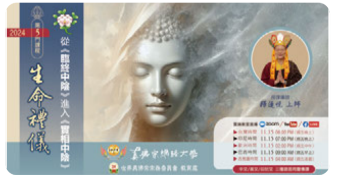
真佛網路大學 生命禮儀課程教導學員 如何經歷七七實相中陰 度過生死大海

真佛網路大學「第五門課程 - 生命禮儀」，已經來到「實相中陰」的階段，也就是我們常聽到的「七七四十九天」的階段。在這個階段，每七天就會經歷一個「小死」，所謂的死，不是肉體的死去，而是指有時候清明，有時候進入昏沉，叫做一階段的「小死」，會有七個階段經歷小死的機會，稱之為七七四十九天。