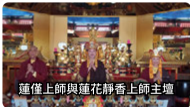
蓮僅上師與蓮花靜香上師主壇