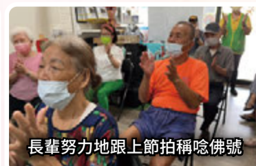
長輩努力地跟上節拍稱唸佛號