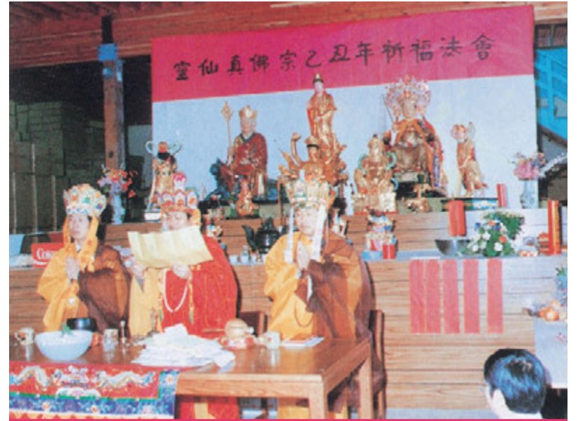
▲在Tukwila舉辦的第五次法會