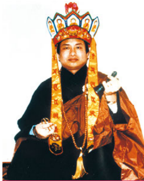
▲紅冠聖冕金剛上師蓮生尊者