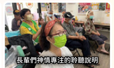
長輩們神情專注的聆聽說明