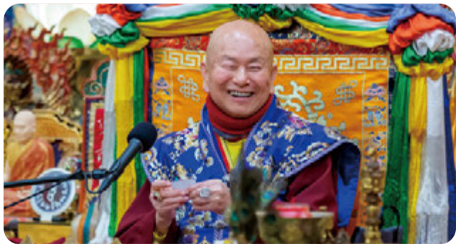
菩薩不住有為無為 度眾不離大慈大悲 平等度眾少欲知足 入世出世兼而行之

盧師尊的弟子提出「空瓶論」。什麼是空瓶論？他的論點是「我們人就像一個瓶子」，你裝了 orange juice，就是一瓶橘子汁。我們學佛，如果裝滿了「佛性」，你就是「佛」；裝了「本尊」進去，就變成「本尊」；裝滿了「業障」，就一定要「輪迴」。所以我們學佛，要先倒掉垃圾裝入智慧，才能破除煩惱。在盧師尊的腦海裡，祂瓶子裡面裝的，一個是「佛性」，一個是「對眾生的感情」。