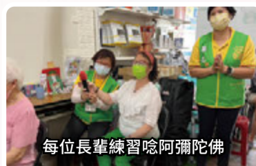
每位長輩練習唸阿彌陀佛