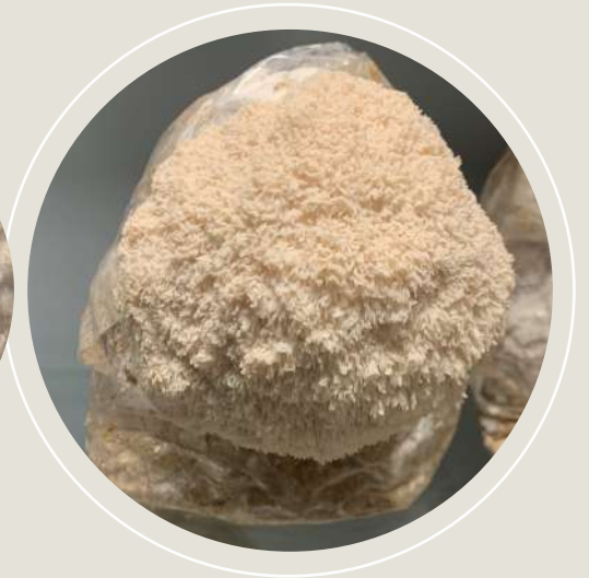
Høstklar Lion's mane