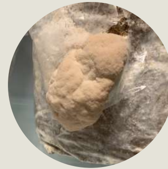
Lion's mane ved levering

Den ugentlige levering vil ske efter aftale, men mandage er ofte det oplagte valg, så svampene kan vokse sig store i løbet af ugen.