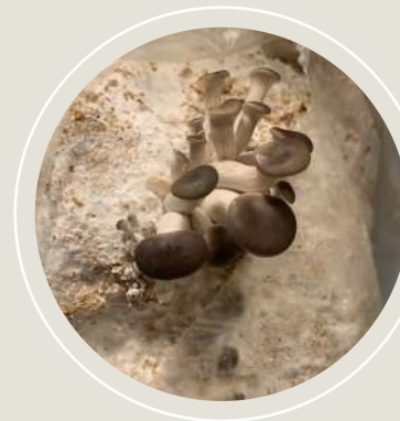
Østershatte ved levering