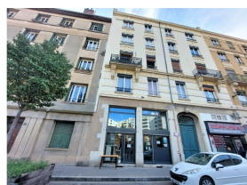
Une "Petite cantine" ouvre le 19 octobre au 10 rue Jubin dans le quartier de Charpennes à Villeurbanne. Le concept ? Un resto de quartier à prix libres et à la cuisine participative.

À 24 ans, elle a travaillé « en centre social » et dans le milieu associatif. Habitante du quartier, elle avait été séduite par les Petites cantines « en tant que convive » : « Ce qui me plaît c'est l'aspect de partage autour de la cuisine et le lien social. Ici on se sent accueilli dans un cadre bienveillant. »