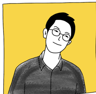
旅程导览与讲解 小鱼先森