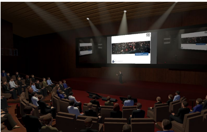
プレゼンテーション時の空間全体イメージ

※また、購入前の体験版としてデモプログラム(期間に応じた製品レンタル、有料)もあわせてご用意します。