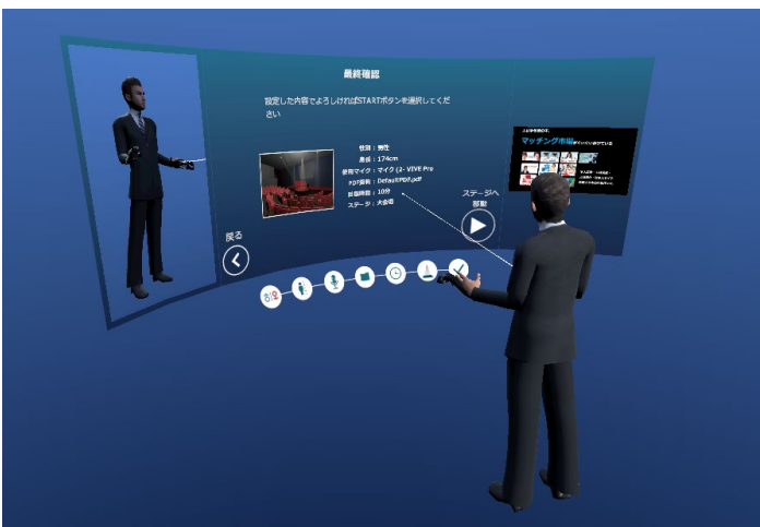
各種設定を行うメイン画面

■本件に関する問い合わせ先 mail: info@edoga.jp 株式会社エドガ 広報担当