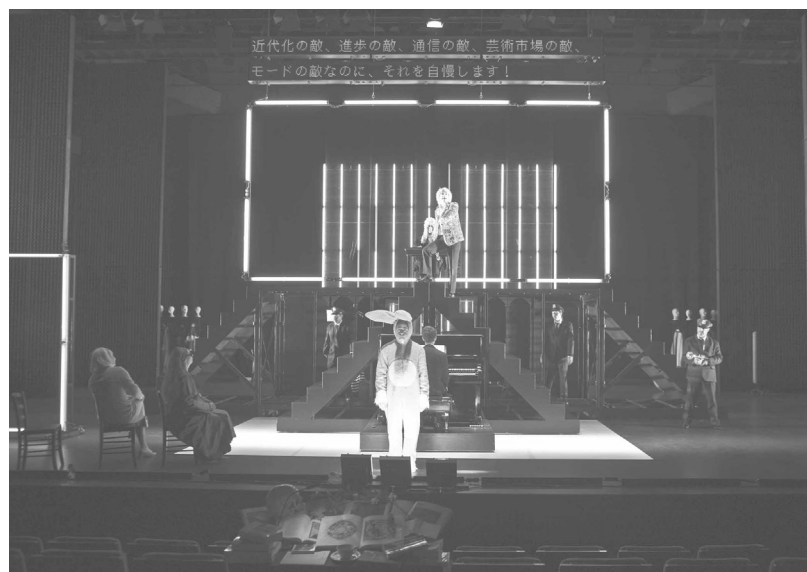
オリヴィエ・ピイ 『イリュージョン・コミック―舞台は夢』より