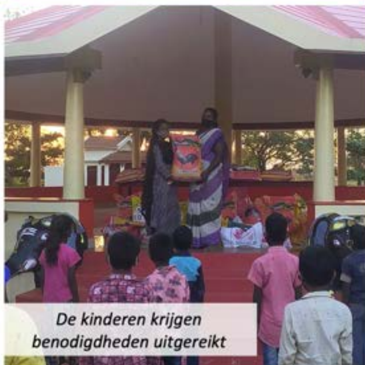
De kinderen krijgen benodigdheden uitgereikt