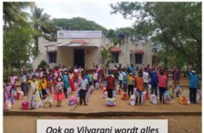
Ook op Vilvarani wordt alles uitgereikt

Dit artikel is ten behoeve van onze nieuwsbrief door onze redactie vertaald en ingekort, lees het originele artikel op onze website.