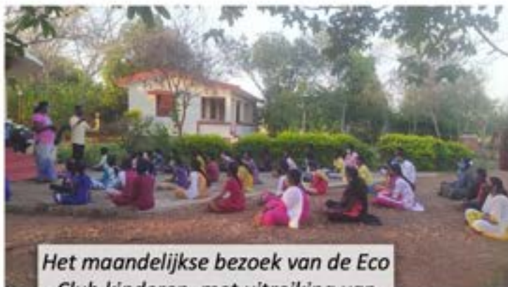
Het maandelijkse bezoek van de Eco Club kinderen, met uitreiking van benodigdheden op Wonderland

straatverkopers. Deze mensen hebben geen spaargeld en op dit moment geen inkomsten. En kunnen zich dagelijkse basisbehoeften (water, melk, fruit) niet veroorloven voor zichzelf en hun gezinnen. Los daarvan is er nauwelijks aanbod van dergelijke producten. Er ontstaat schaarste en de prijzen vliegen omhoog.