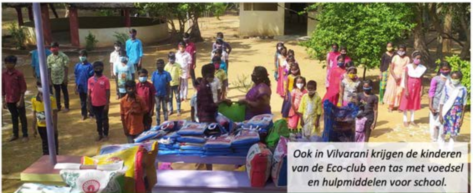
Ook in Vilvarani krijgen de kinderen van de Eco-club een tas met voedsel en hulpmiddelen voor school.