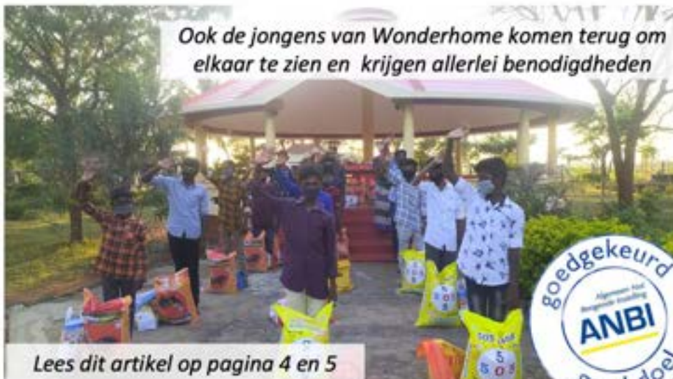
Ook de jongens van Wonderhome komen terug om elkaar te zien en krijgen allerlei benodigdheden

In de laatste nieuwsbrief schreef ik, uw penningmeester, een hartenkreet. Alle perikelen rondom corona maakte niet alleen de situatie in India zorgelijk. Ook in Nederland ontstonden zorgen bij het bestuur over de fondsenwerving. Wij konden namelijk geen activiteiten initiëren, omdat het in de verschillende lockdowns gewoonweg niet mogelijk was om elkaar te zien of iets te organiseren. Gelukkig kan ik melden dat de hartenkreet door u, onze trouwe vrienden en donateurs, is gehoord. Wij ontvingen na de oproep in de nieuwsbrief niet alleen meer donaties, maar ook hogere bedragen. Heel fijn. We zijn blij en dankbaar dat u, vooral ook in deze bijzondere tijden, aan de kinderen in India heeft gedacht.