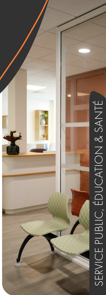
SERVICE PUBLIC, ÉDUCATION & SANTÉ