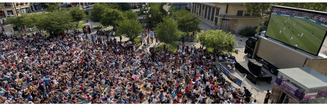
Manuel AESCHLIMANN Maire d'Asnières-sur-Seine