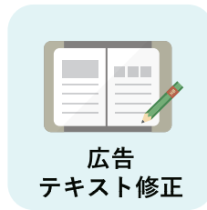
広告 テキスト修正