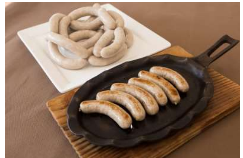
手づくりウインナー調理イメージ