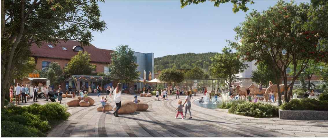
Skisse til nye Gran torg, Snøhetta arkitekter