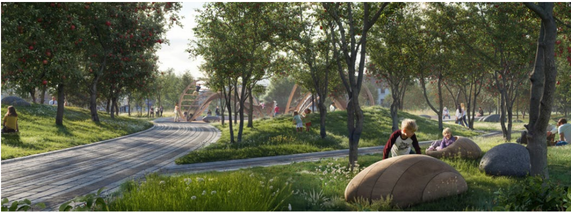
Skisse til ny park i Gran sentrum, Snøhetta arkitekter