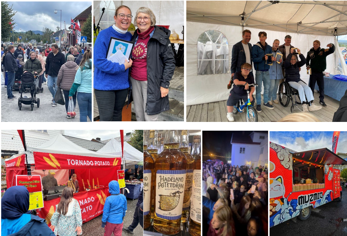
Liv og røre i Gran ved GHH sine arrangementer gjennom året