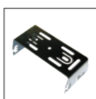
Kit staffa di montaggio ADFM78