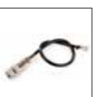
Adattatore microfonico 8-pin EDS-8