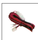
Cavo alimentazione cc ADUA38