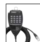
Microfono DTMF EMS-79