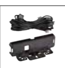
Kit di separa- zione del pannello frontale EDS-30