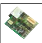
Unità di modulazione digitale EJ-47U