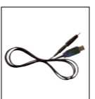
Cavo di interfaccia PC ERW-7