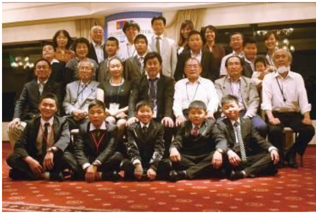
お別れパーティ集合写真

夕方から行われたお別れレセプションでは、ホストファミリーと一般市民の方がた、関係者が集い、盛大に行われました。