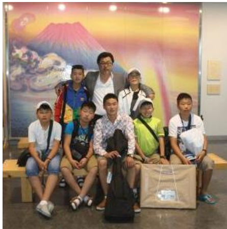
帰国前に富士山静岡空港にて