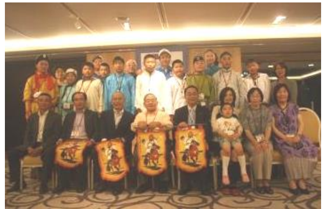
歓迎レセプションにて

和やかな雰囲気の中で始まったレセプションでは、民族衣装に着替え、馬頭琴の演奏や「民族踊り」・「馬のほめ歌」などを披露し、最後に「ふじの山」を覚えてきた日本語で研修生全員の合唱がはじまると、会場からも歌声が響きました。