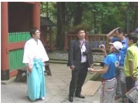
久能山東照宮で説明を受ける