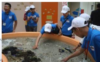
水族館にて、魚やヒトデと戯れて

静岡市清水区三保にある東海大学海洋博物館に伺い、水族館の視察をしました。 水族館もモンゴルにはなく、様々な海の生物を間近に見て驚きの様子でした。