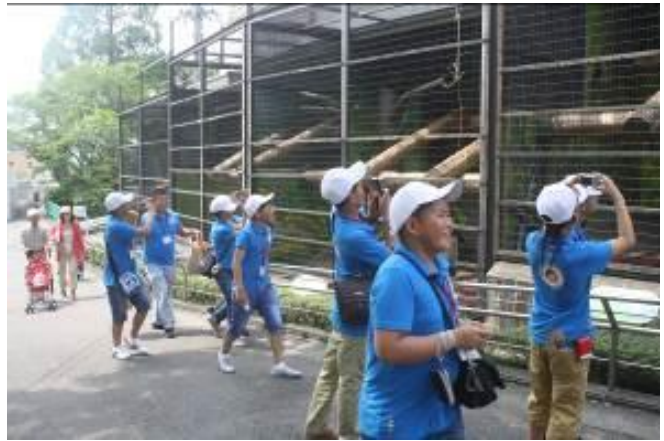
日本平動物園オランウータン舎前で

モンゴル国には動物園がないと言ふことで、珍しい動物を見つけたらに研修生たちは目を輝かせていました。