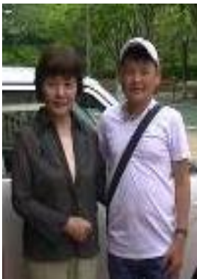
送って下さったホストファミリーと

静岡県ボランティア協会(静岡県総合福祉会館)で、研修生たちはホストファミリーから親善協会に引渡しを受けました。