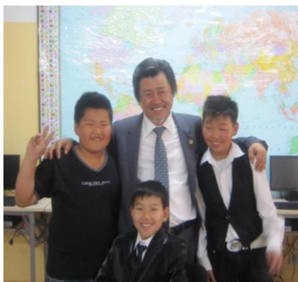
ドルノゴビにて子どもたちと

モンゴル国は、東アジア北部に位置する国で、静岡県がモンゴル国ドルノゴビ県と友好協定を二〇一〇年七月に締結されている事から、民間での草の根的な友好を深める機会を創っていく事を目的に、「静岡・モンゴル親善協会」を発足させ、日本語学校の開設・日本への留学の支援・日本技術の習得などの文化交流等を広げていきたいと考えております。