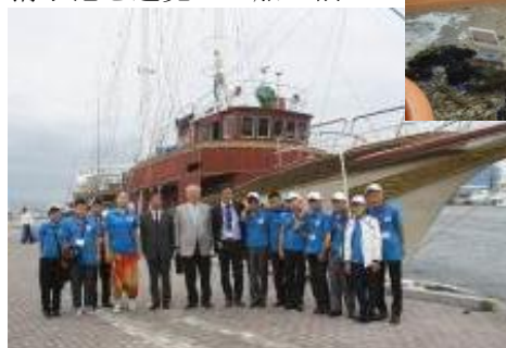
清水港を遊覧した船の前で

昼食は、エスパルスドリームフェリーの「オーシャンプリンセス号」に乗船し、清水港の湾内をクルーズしながら食事をしました。貴重な体験に研修生たちも大喜びでした。