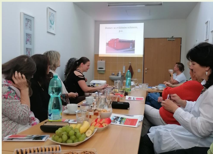
► Petřvald 10.10. 2023 – 16.10.2023