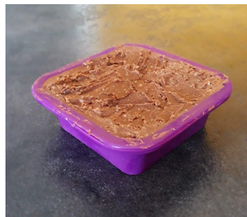
Etape 4, moulage