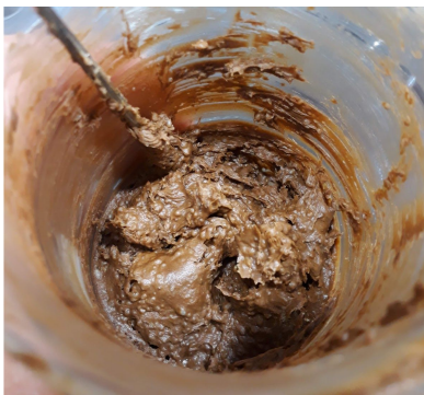
Etape 2, ajout de la poudre hors du bain marie