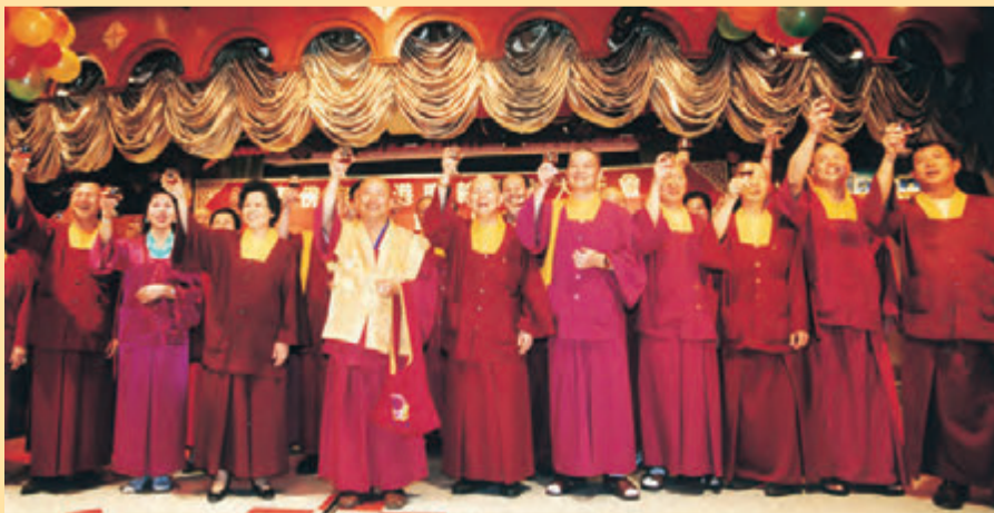
▲蓮生活佛在香港「時輪金剛不共大法」的謝師宴和眾弟子們舉杯之後，隨即走入了隱居與閉關的時期。