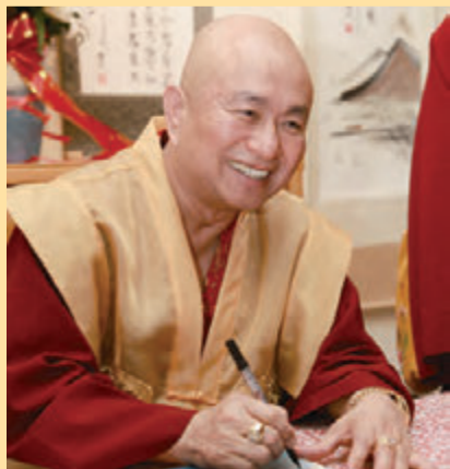
▲蓮生活佛在六年半的閉關期間，仍然寫作不懈，推動著度化眾生的使命，幾乎是1個月出版一本書的速度。

緬懷西雅圖的情景，還有思念各地的真佛弟子們，似乎是難解的問題。大家是否還道心堅固的修法嗎？弘法及慈善的資糧積聚得足夠嗎？因而蓮生活佛常在禪定中出神，元神一下子飛回台灣；一下子在