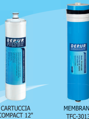
CARTUCCIA COMPACT 12"

L'osmosi inversa serie PURA è un prodotto Made in Italy costruito utilizzando solo i migliori materiali ed i più avanzati sistemi di lavorazione e viene fornito completo di manuale d'istruzioni e kit di montaggio per una semplice e corretta installazione. Così come richiesto dal D.M. 174/2004, tutti i componenti del circuito idraulico sono atossici non rilasciano nulla nell'acqua, e sono realizzati con materiali idonei al contatto con acqua ad uso potabile. Ecologico, affidabile e tecnologicamente avanzato, l'osmosi inversa serie PURA è un'apparecchiatura per il trattamento di acque potabili conforme al Decreto del Ministero della Salute n° 25/2012 e conforme alla direttiva CE.