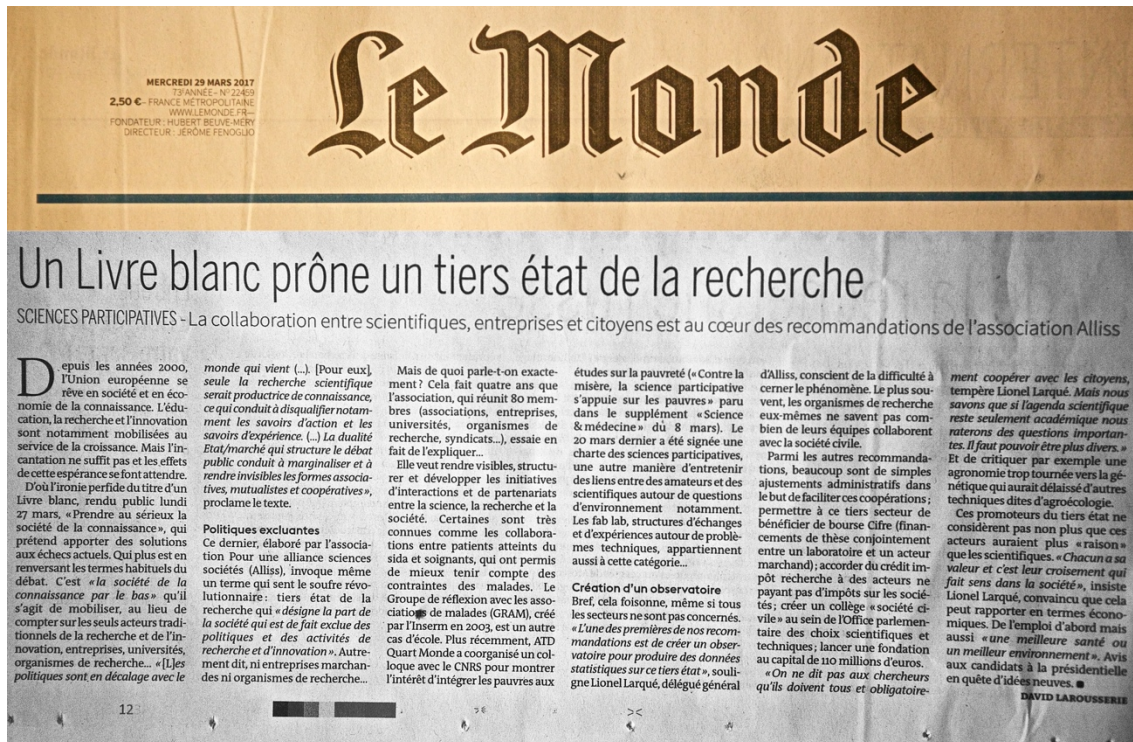
Article du Monde paru le 10 mai 2017