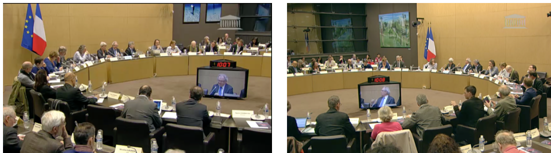
Prise de vue de la session publique au Parlement le 27 mars 2017