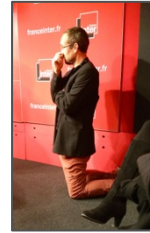
Médiatisation des travaux du panel sur les ondes de France Inter le lundi 10 avril 2017