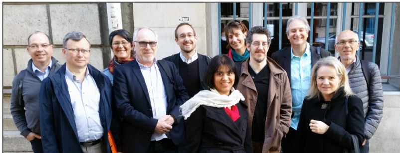
Le panel citoyen de la Chaire Bernard Maris devant la Mairie de Paris