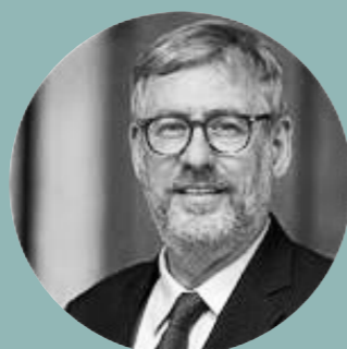
BARON LUC TAYART DE BORMS