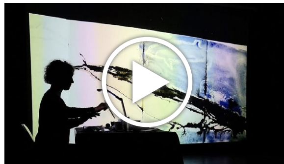
Concert dessiné à Aix-en-Provence, Théâtre 108, 2024